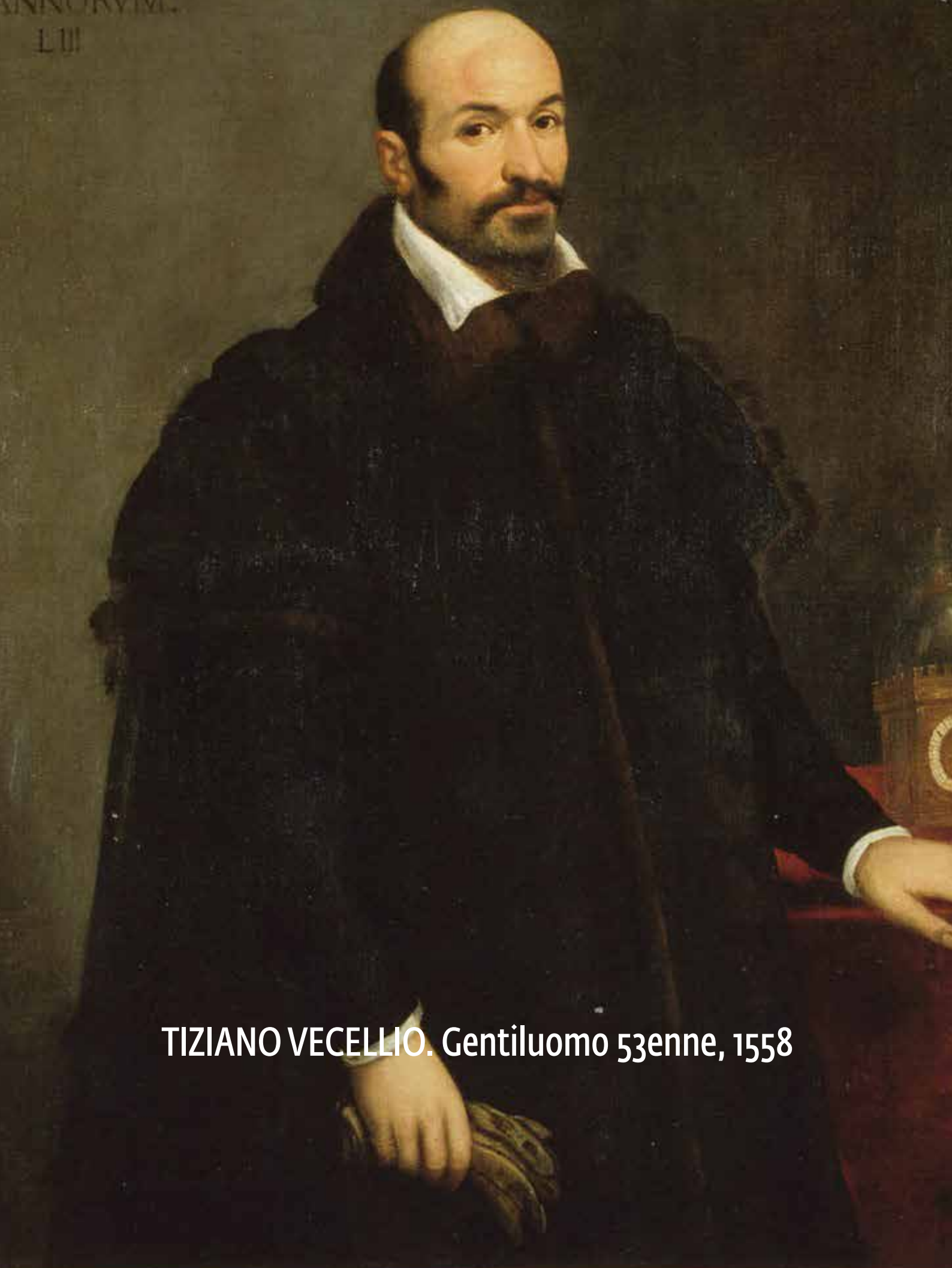
TIZIANO VECELLIO. Gentiluomo 53enne, 1558