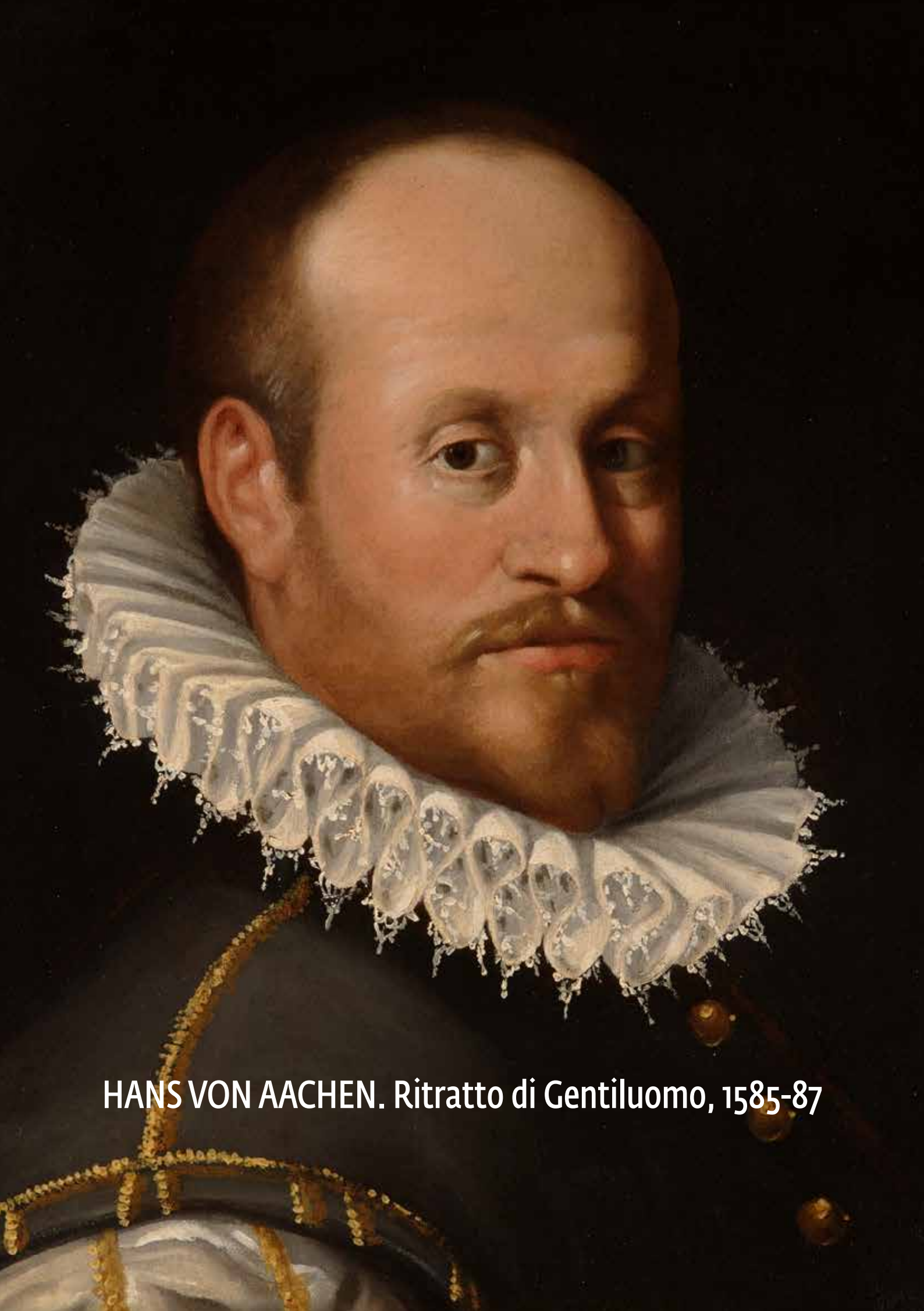
HANS VON AACHEN. Ritratto di Gentiluomo, 1585-87