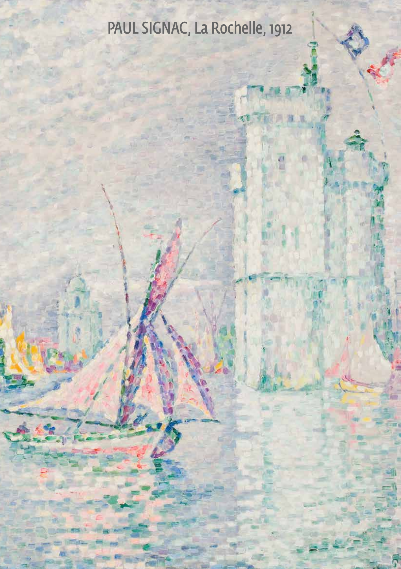
PAUL SIGNAC, La Rochelle, 1912